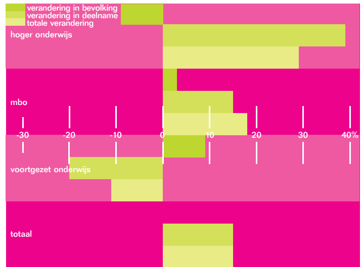
Ontwikkeling aantal leerlingen (16 jaar e.o.), '95/'96-'07/'08

Steeds meer leerlingen blijven na afloop van de volledige leerplicht in het onderwijs of keren daarin terug. Dit komt vooral door de toegenomen populariteit van het hoger onderwijs. Het aantal leerlingen en studenten van 16 jaar en ouder was in het schooljaar 2007/'08 15 procent hoger dan in het schooljaar 1995/'96. Per onderwijssoort zijn er forse verschillen. Het aantal leerlingen van 16 jaar en ouder in het voortgezet onderwijs nam, met 11 procent, sterk af. In het hoger onderwijs nam het aantal leerlingen daarentegen flink toe, met 29 procent. Het middelbaar beroepsonderwijs (mbo) tenslotte, groeide met 18 procent. Door Dick Takkenberg .