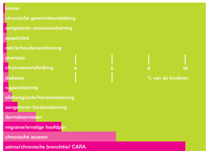
Prevalentie van langdurige aandoeningen bij kinderen van 4 tot 12 jaar, 2001-2007