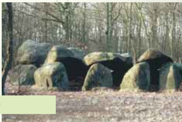
Hunebed in Drenthe

Het meetnet korstmossen is een kleine, maar interessante loot aan de NEM-boom. Dit meetnet werd gestart in 1999 en richt zich op de meest zeldzame en bedreigde soorten, waaronder die op hunebedden. Van hunebedden zijn ook oudere gegevens voorhanden. In 2000 werden op hunebedden 27 soorten van de rode lijst aangetrof-