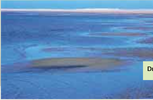
Droogvallende zandplaten bij Terschelling

belang. Weliswaar bevat de richtlijn geen plicht om over de ontwikkelingen te rapporteren aan Brussel, maar het Ministerie van LNV wil wel graag bijhouden in hoeverre de bescherming van de betreffende gebieden en soorten vruchten afwerpt.