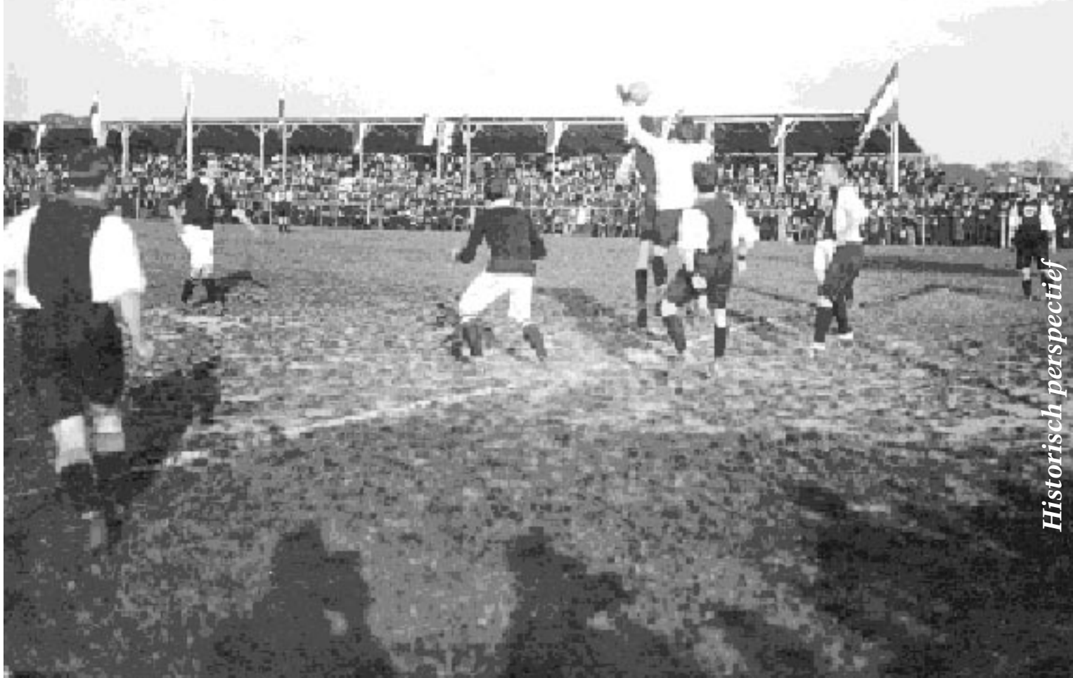
De voetbalwedstrijd Nederland – Duitsland (1910).