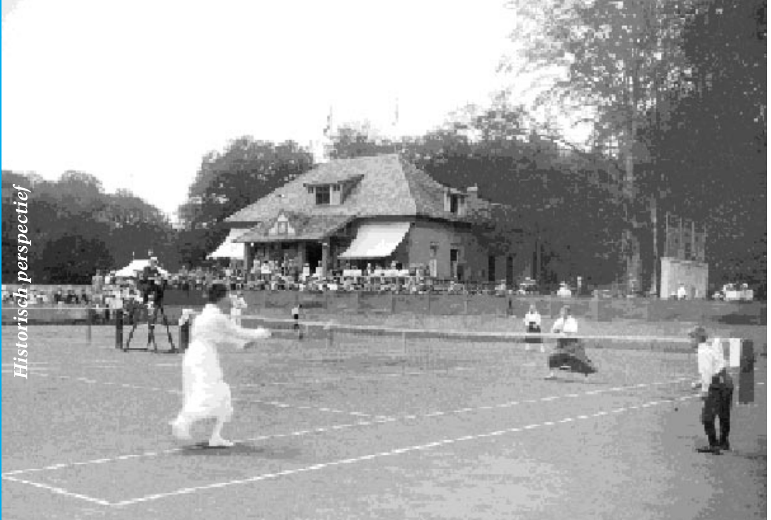
Tennissen in Klarenbeek (1918).

gigantische ontvangst thuis en een goedgevulde geldbuidel. Dat zal het tweede grote verschil met honderd jaar geleden zijn: de invloed van de commercie, het geld, de financiële belangen. Mediamagnaat Murdoch dreigt Manchester United op te kopen, Ajax gaat naar de beurs (en vergeet de landstitel) en een beetje tennisser houdt er op zijn 25e mee op om te gaan wonen in Monaco.