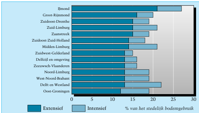
Bodemgebruik door bedrijven, 1993 (extensief gebruik boven landelijk gemiddelde)