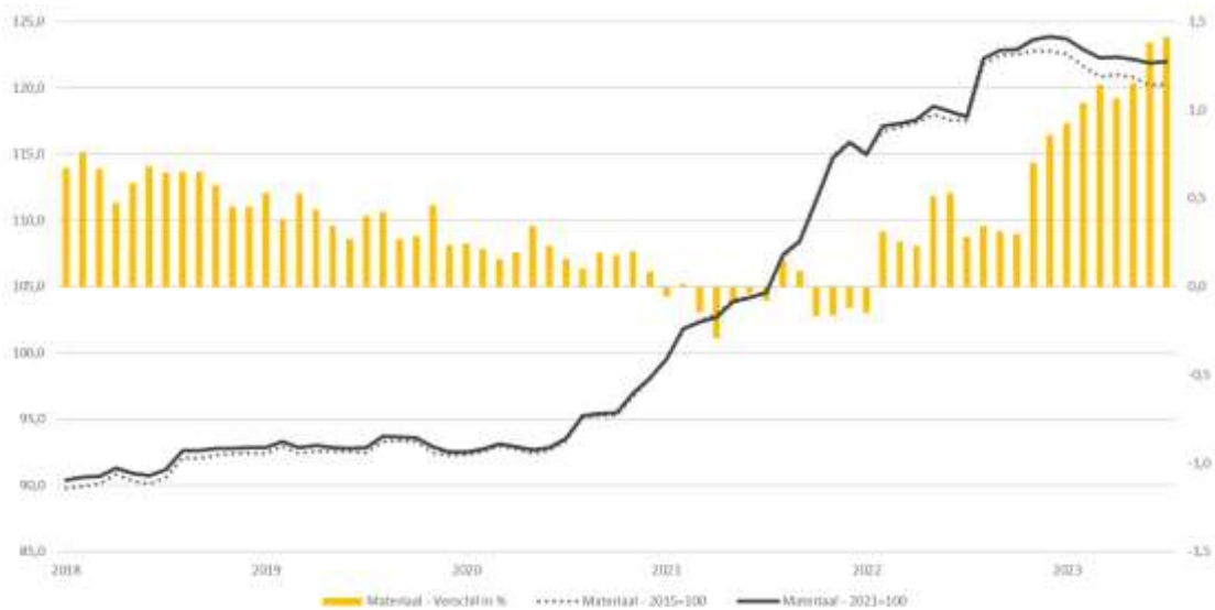
Grafiek 1: Indices materiaalcomponent op basis 2015=100 en 2021=100

Doordat de oude reeks 2015=100 voor deze grafiek is herschaald naar 2021=100, zijn de verschillen tussen beide reeksen zichtbaar gemaakt. Over bijna de hele periode ligt het prijsindexcijfer van de materiaalcomponent op de oude basis onder de nieuwe reeks. Dit geeft een verschil van maximaal 1,4 procent. Dit verschil heeft twee oorzaken. Ten eerste is de materialenreeks opgebouwd uit PPI-indices. Hier heeft een basisverlegging plaatsgevonden, waardoor de reeksen zijn veranderd. Ten tweede is het wegingschema waarmee de prijsindexcijfers worden berekend aangepast (zie 2.1). Dit heeft invloed op de gehele reeks. De verschillen vanaf 2022 zijn zichtbaar groter. Over de hele periode is het gemiddelde verschil 0,4 procent. Bij de vorige basisverlegging van 2010=100 naar 2015=100 was dit iets kleiner, namelijk 0,2 procent.