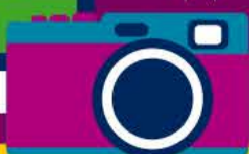
foto- en film- apparaten -66%