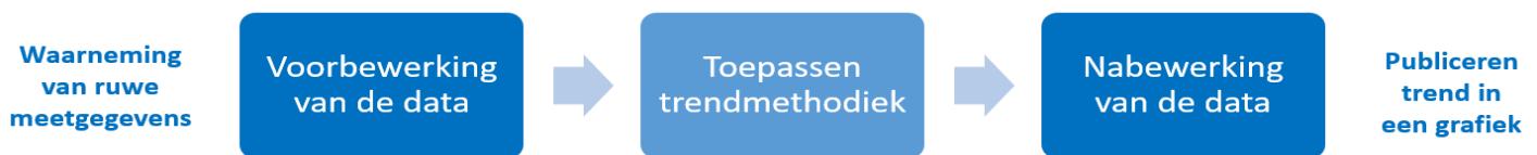
Figuur 2: Het door te lopen traject: van ruwe meetgegevens naar het te publiceren trendanalyseresultaat. In de te publiceren grafiek is zichtbaar of de trend dalend, stabiel of stijgend is

Bij het maken van de juiste keuzes in de opdrachtverstrekking dient het hele traject in beschouwing genomen te worden; d.w.z. van ruwe meetgegevens naar het te publiceren trendanalyseresultaat. De belangrijkste processtappen staan in Figuur 2.